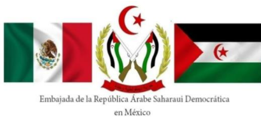
Embajada de la República Árabe Saharaui Democrática en México