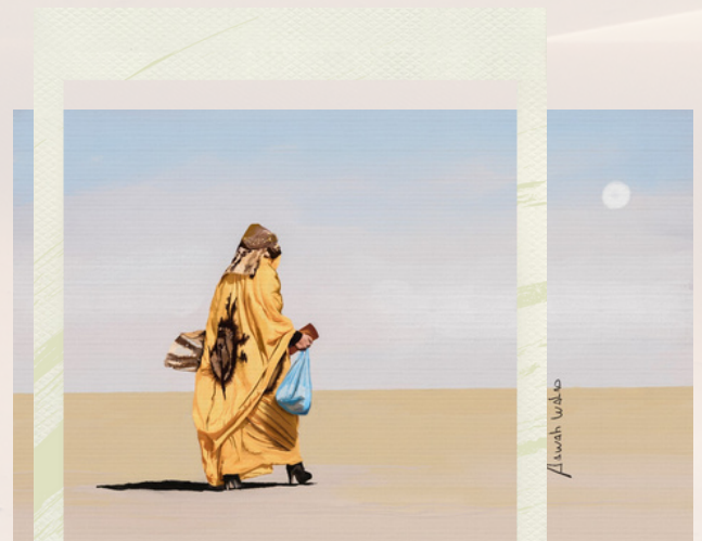
Pintura en Óleo por el artista Aawah Walad