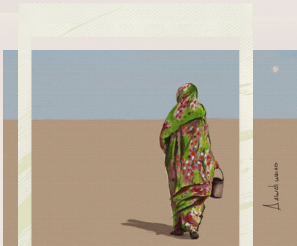
Pintura en Óleo por el artista Aawah Walad